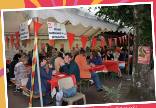
Le repas partagé par 150 convives a été un véritable succès.

2200 Le nombre de personnes qui a fréquenté la MPT