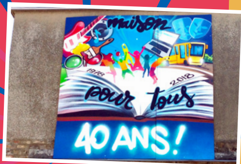
Pour ses 40 ans, la Maison pour tous a pris des couleurs.