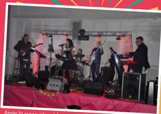
Après le repas, place à la musique et à la danse. Higher ground, le groupe lillois a retracé les 40 ans en chansons.