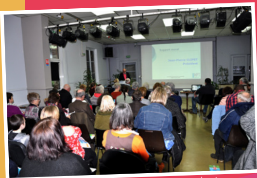
Salle comble pour l'assemblée générale le 29 mars dernier.